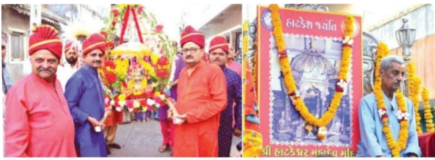
જામનગર પાટોત્સવ-ફોટા સૌજન્ય શ્રી ચિરાગ ભુચ