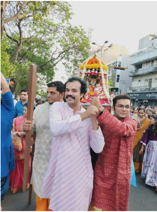
પાટોત્સવ ઉજવણીની તસ્વીરી ઝલક