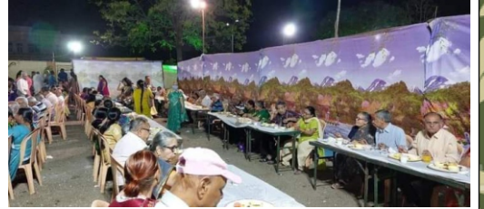
સમૂહ ભોજન રાજકોટ