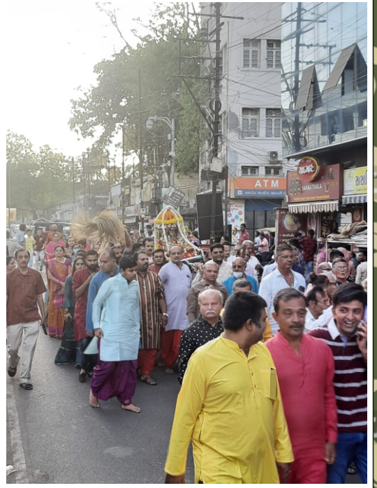
રાજકોટ પાટોત્સવ દાદાની શોભાયાત્રા