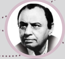
અપિનાશ વ્યાસ (મૂર્ધન્ય કવિ)