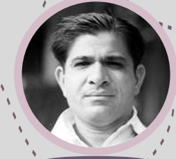
પિનુ. માંકડ (જગ વિખ્યાત ક્રિકેટર)