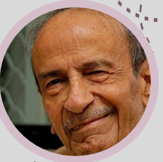
તારક મહેતા (ખ્યાતિ પ્રાપ્ત હાસ્ય લેખક)