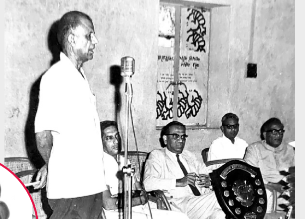
જીત મેળવેલ ક્રિકેટ ટીમના સત્કાર સમારંભમાં વક્તવ્ય