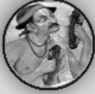
કવિશ્રી નરસિંહ મહેતા